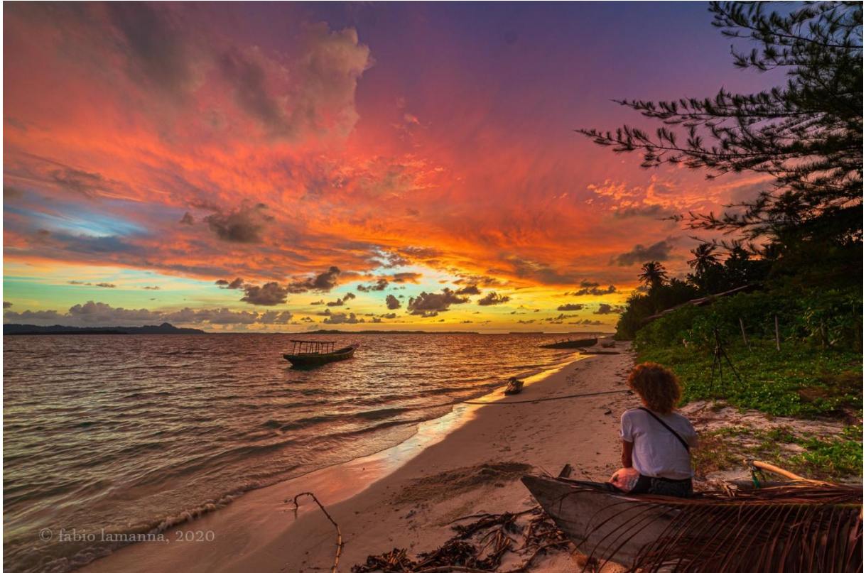
Voilà les photos des amis sur l'île déserte.